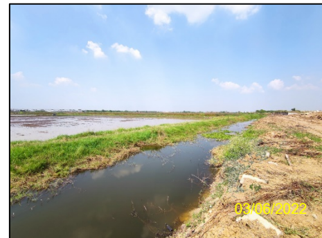
ทิศตะวันตก