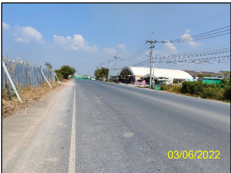
ทิศตะวันออก