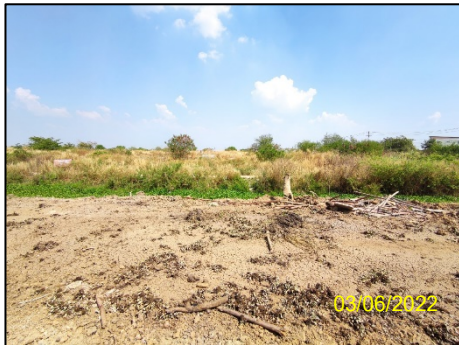
ทิศเหนือ