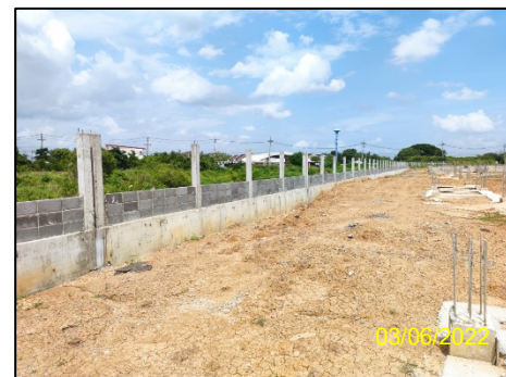
ภาพที่ 1-2 สภาพปัจจุบันของโครงการ